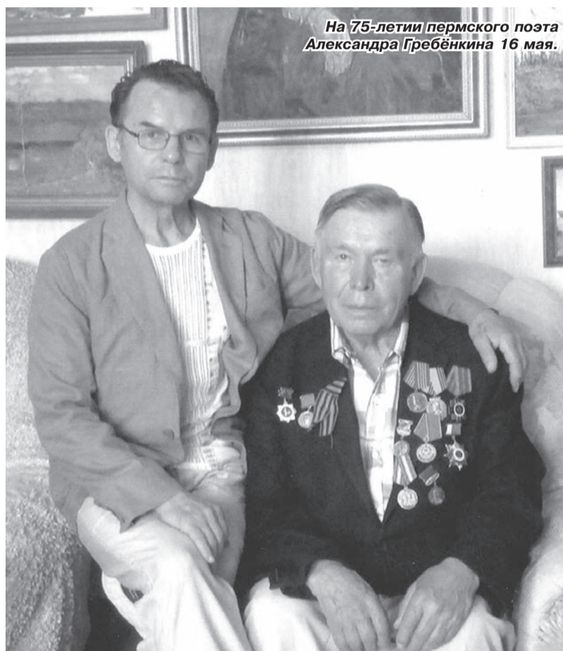
На 75-летию пермского поэта Александра Гребёнкина 16 мая.

логизации образа Поэта посредством передачи художником настроений. Свидетельство тому – лучшие злобинские работы этого цикла: «Дожди», «Послание в Сибирь», «Пророк», «Я памятник воздвиг себе нерукотворный», «Пускай умру, но умру любя...», постель «Пушкины» и оба портрета Поэта, графический рисунок «Болдинская осень» и другие. Психологически обоснованный и биографически мотивированный образ «солнца русской поэзии» Злобин часто информационно насыщает и, благодаря символике и аллегориям, полифонизирует.