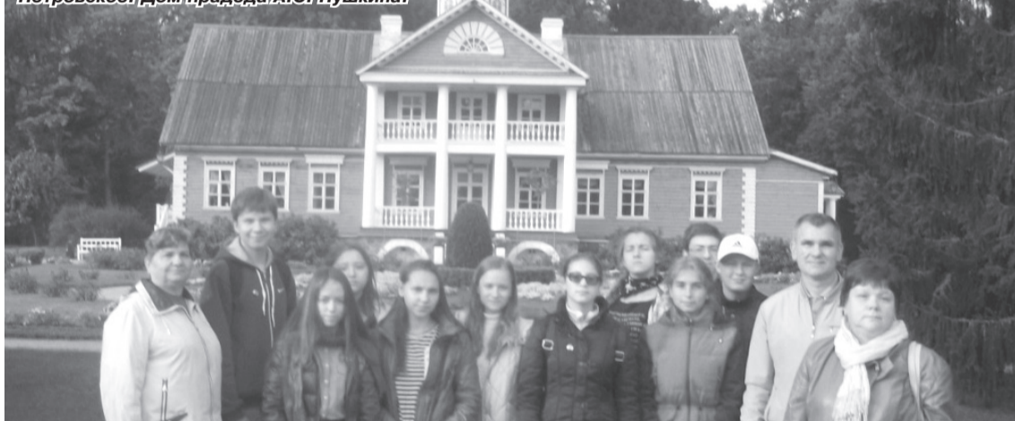
Петровское. Дом прадеда А.С. Пушкина.