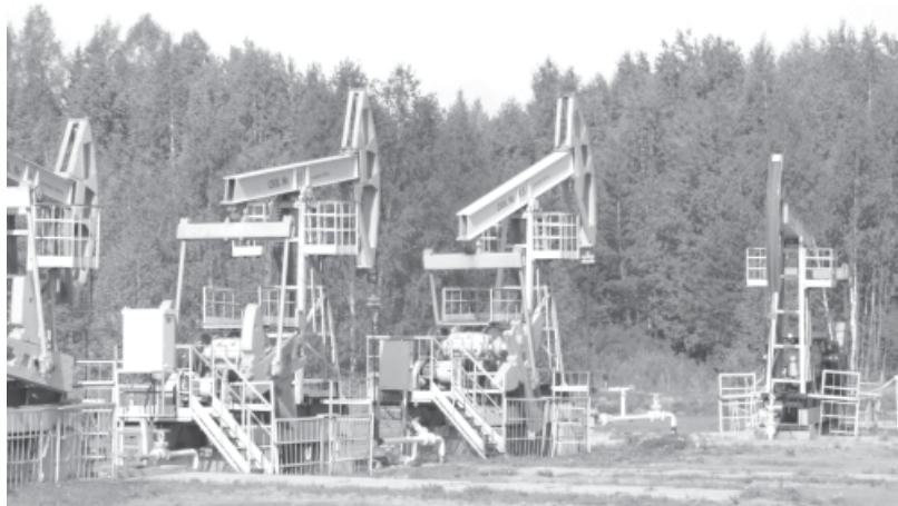
Станки-качалки ЦДНГ-9 в Шумах.