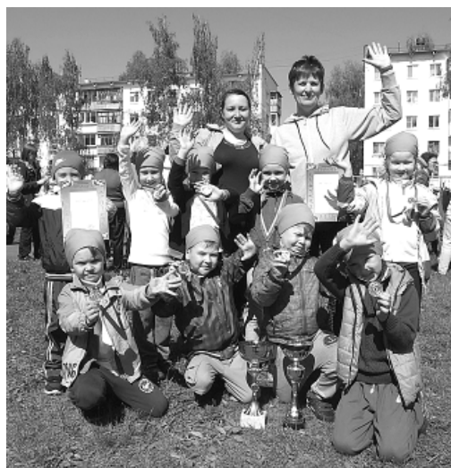
Абсолютные победители большой легкоатлетической эстафеты из детского сада №14 «Колокольчик».