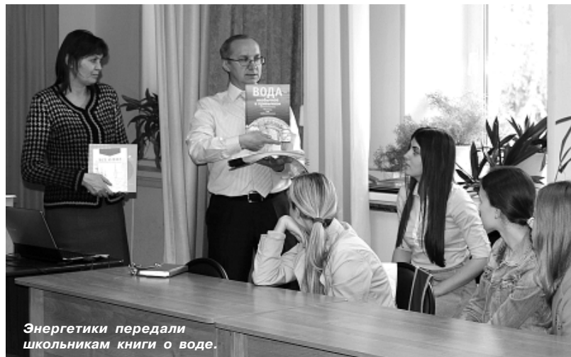
Энергетики передали школьникам книги о воде.

Особое внимание гости уделили проблеме маловодья на Волге в этом году и работе водохранилищ, которые помогают сгладить его последствия, обеспечивают условия для су-