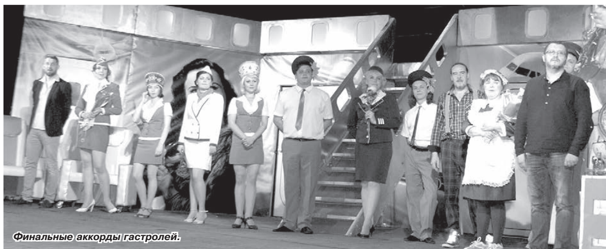
Финальные аккорды гастролей.