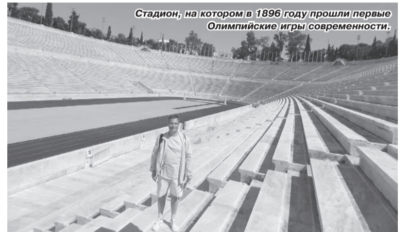
Стадион, на котором в 1896 году прошли первые Олимпийские игры современности.