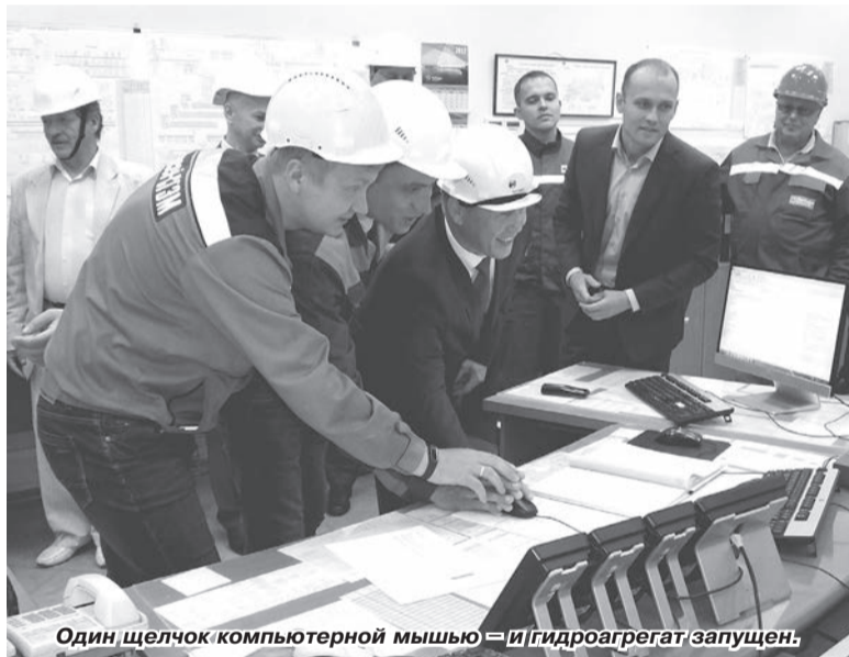
Один щелчок компьютерной мышью – и гидроагрегат запущен.

В рамках Программы комплексной модернизации (ПКМ*) «РусГидро» на Воткинской ГЭС завершили модернизацию гидроагрегата №4. Он стал первым модернизированным гидроагрегатом станции. В ходе работ, длившихся в течение 11 месяцев, выполнена замена турбины, генератора, вспомогательного оборудования гидроагрегата, проведена модернизация системы автоматического управления гидроагрегатом.