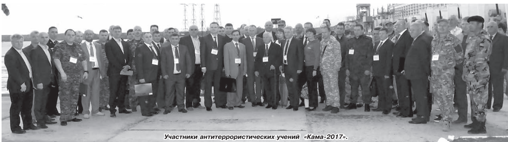
Участники антитеррористических учений «Кама-2017».

По окончании учений, которые, помимо всего, оказались очень зрелищными и интересными, были подведены их итоги и намечены мероприятия по повышению безопасности и антитеррористической защищённости. Компания «РусГидро» – это одно из ключевых звеньев энергетической системы Российской Федерации, и отработанные на учениях решения будут внедряться на объектах ТЭК повсеместно, что повысит безопасность российской энергетики в целом.