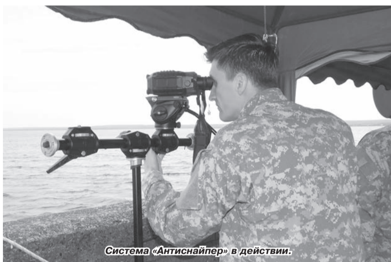
Система «Антиснайпер» в действии.

Может возникнуть вопрос, почему подобные учения проводились на Воткинской ГЭС. Всё дело в том, что топливно-энергетический комплекс (ТЭК) имеет системно важное, базовое значение для функционирования всей экономики России. А Воткинская ГЭС – один из таких центров, где компания «РусГидро» ранее запланировала проведение подобных научно-практических мероприятий, опыт которых впоследствии предполагается использовать в системах безопасности других объектов компании. Позже эта идея развернулась до государственных масштабов. К её реализации были привлечены Национальный антитеррористический комитет, Министерство энергетики, силовые структуры.