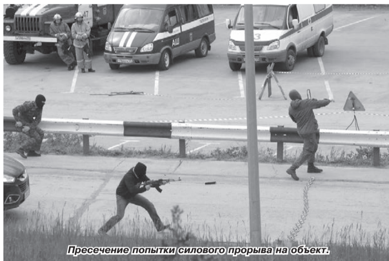
Пресечение попытки силового прорыва на объект.

Подразделение охраны обнаружило противника и, во взаимодействии с силовыми структурами, после короткого преследования перехватило террористическую группу, обезвредило её и конвоировало к берегу. При пресечении попытки незаконного проникновения на территорию Воткинской ГЭС использовались самые современные серийные и перспективные образцы гидро-