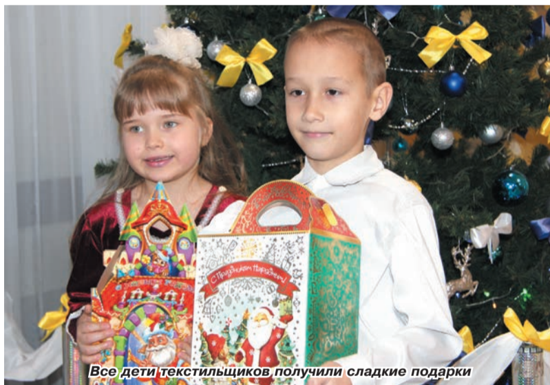
Все дети текстильщиков получили сладкие подарки