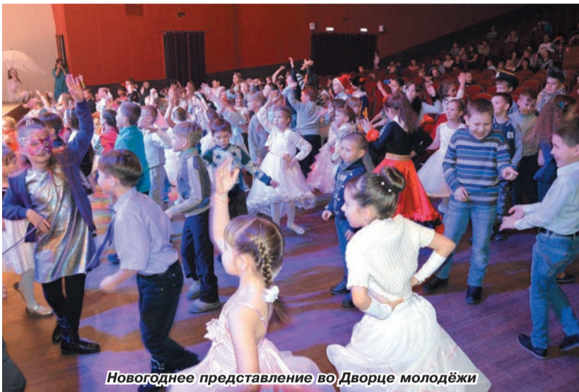
Новогоднее представление во Дворце молодёжи

Новогодние праздники – время чудес и долгожданных подарков. Из года в год компания «Чайковский текстиль» помогает детям окунуться в атмосферу доброты и сказки.