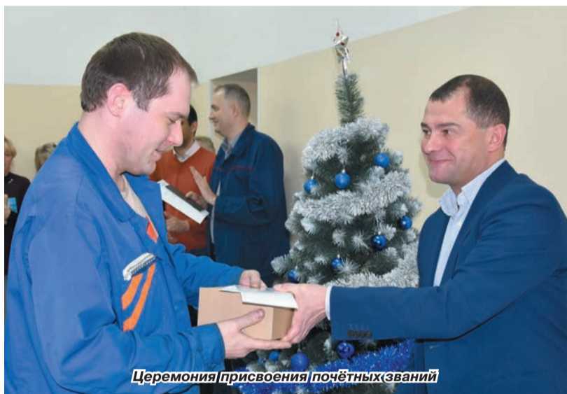
Церемония присвоения почётных званий

В последних числах уходящего года в подразделениях групп компаний «Чайковский текстиль» прошли торжественные собрания, во время которых различными наградами были отмечены лучшие сотрудники.