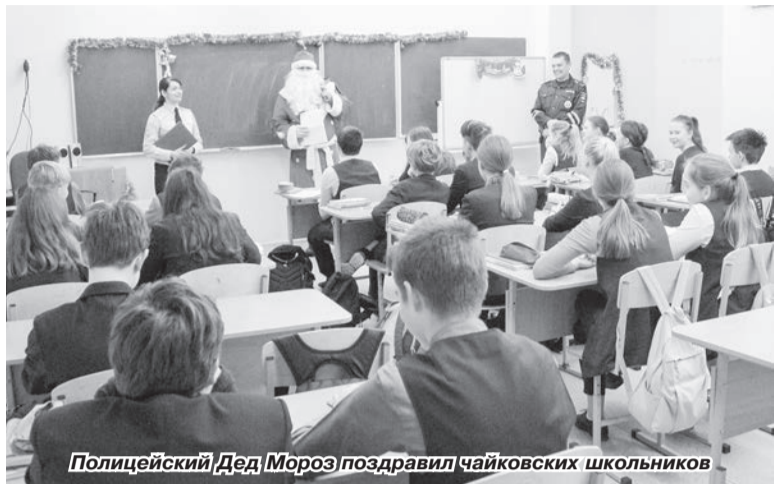
Полицейский Дед Мороз поздравил чайковских школьников

Накануне новогодних праздников примерили на себе костюм доброго волшебника и чайковские полицейские, присоединившись к всероссийской акции «Полицейский Дед Мороз».