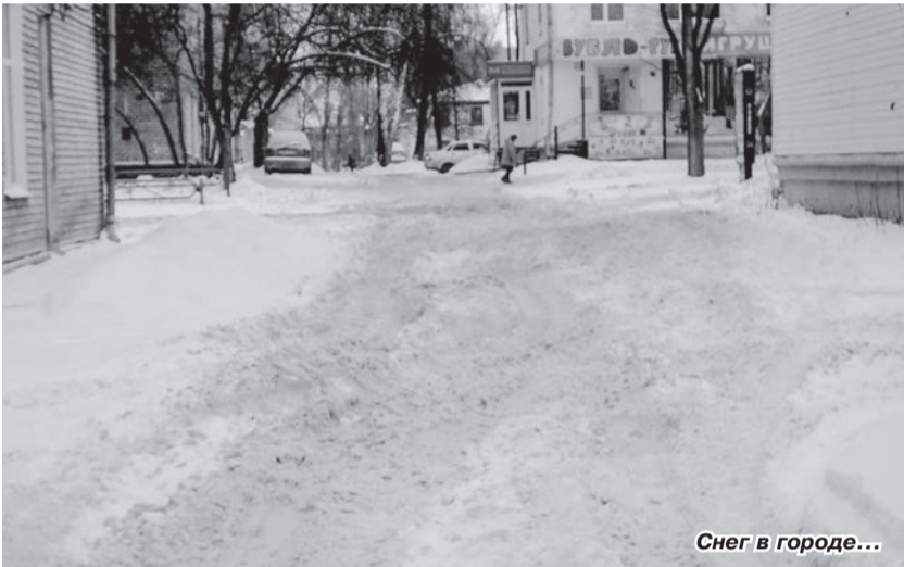
Снег в городе...

Тринадцатого января в администрации Чайковского городского округа прошло первое в 2020 году аппаратное совещание, на котором подведены первые итоги и озвучены новые задачи.