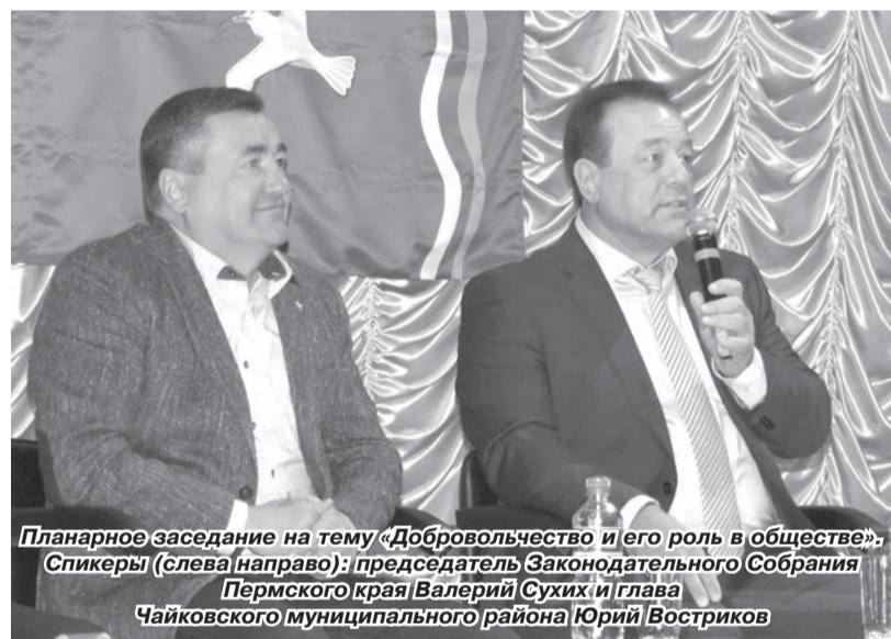
Планарное заседание на тему «Добровольчество и его роль в обществе». Спикеры (слева направо): председатель Законодательного Собрания Пермского края Валерий Сухих и глава Чайковского муниципального района Юрий Востриков

– Сегодня были представлены очень интересные практики добровольческой деятельности на местах. Где-то одни задачи решаются луч-