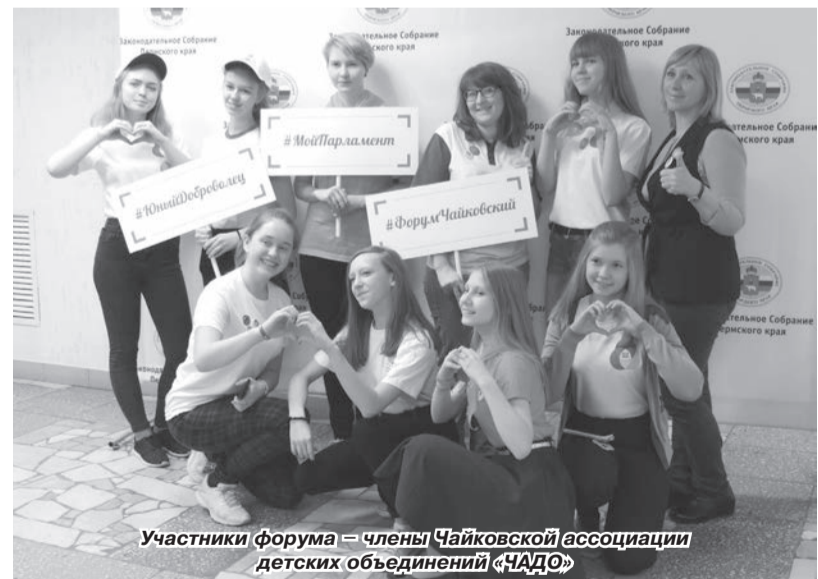
Участники форума – члены Чайковской ассоциации детских объединений «ЧАДО»

ещее проблему жестокости в обществе. И вот учительница спросила учеников, а сталкивался ли кто-то из них с жестокостью? Тогда один из пятиклассников рассказал: «По выходным возле нашей школы сидит нищий. Он слепой и ничего не видит. Когда проходящие мимо люди бросают ему в шапку монету, он кланяется и говорит «спасибо!». Однажды я стал свидетелем того, как компания подростков кидала в шапку просящему обыкновенную крышечку от пивной бутылки. Нищий кланялся и говорил «спасибо!», а ребята смеялись...». Задумайтесь: ни эта ли жестокость, с которой многие из нас сталкиваются уже в юном возрасте, становится тем зерном, из которого впоследствии вырастает потребность помогать людям, не проходить мимо несправедливости? Волонтерство – это и есть потребность души. Оно всегда идёт от сердца и никогда не рассчитывает на похвалу и денеж-