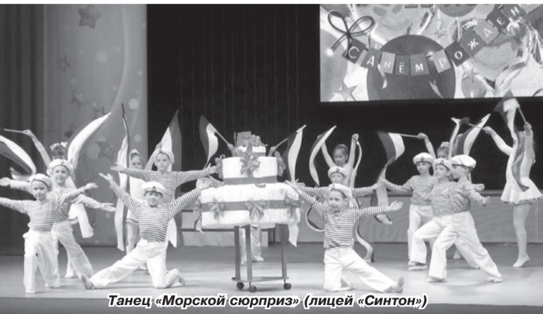
Танец «Морской сюрприз» (лицей «Синтон»)

Утром двадцатого апреля складывалось впечатление, что Дворец молодёжи превратился в гигантский детский сад, потому что к нему со всех концов города большими или маленькими группками устремились малышня. Затем на протяжении двух часов из зрительного зала доносились ритмичная музыка и восторженный детский многоголосый шум – выдержать всё это было под силу только хорошо тренированным барабанным перепонкам. Но происходящее не было вселенским катаклизмом, как могло показаться на первый взгляд, – так в пятнадцатый раз прошёл традиционный фестиваль воспитанников детских садов «Спорт+музыка».