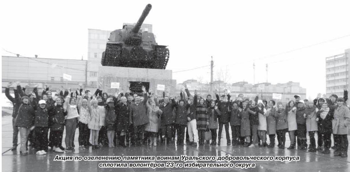
Акция по озеленению памятника воинам Уральского добровольческого корпуса сплотила волонтеров 23-го избирательного округа