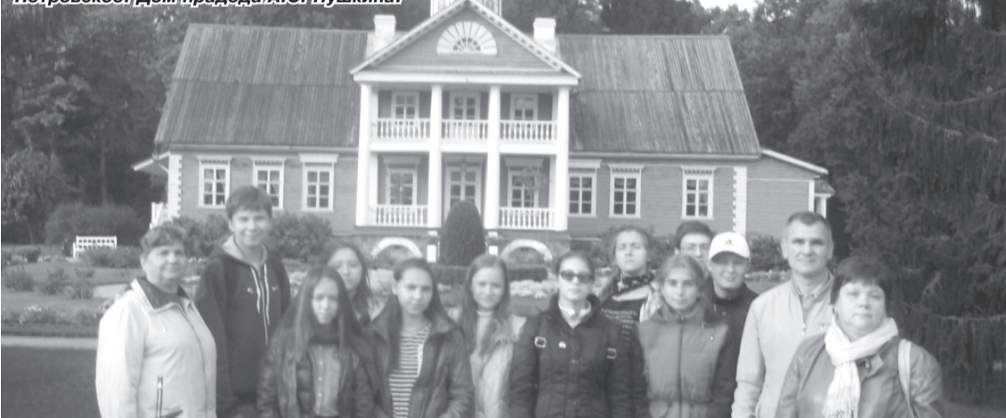
Петровское. Дом прадеда А.С. Пушкина.