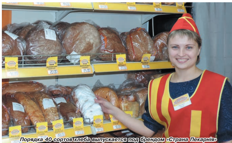
Порядка 40 сортов хлеба выпускается под брендом «Страна Пекарня»