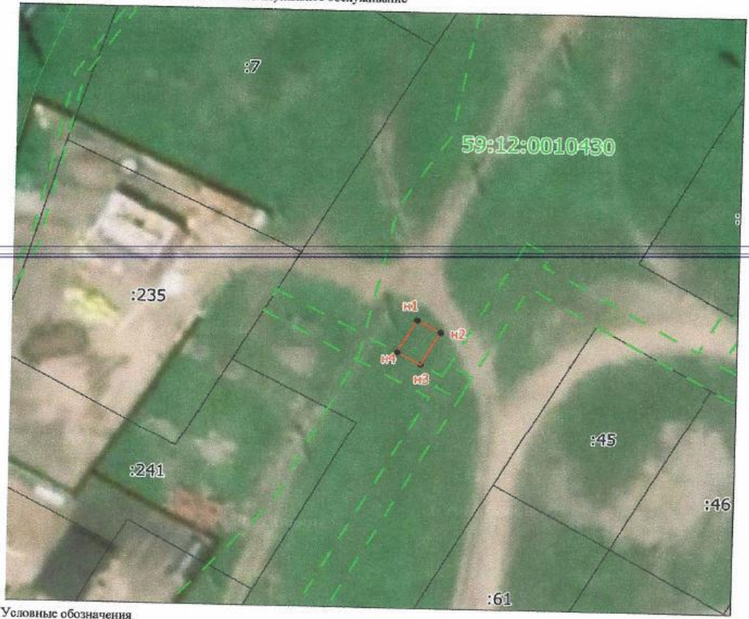
Каталог координат, м Система координат МСК-59, зона 1

Объект: Строительство КТП №215/250 кВА Местоположение: Пермский край, г. Чайковский, проезд Первостроителей Площадь земель или части земельного участка, кв.м.: 24 кв.м. Категория земель: Земли населенного пункта Вид разрешенного использования: 3.1. Коммунальное обслуживание