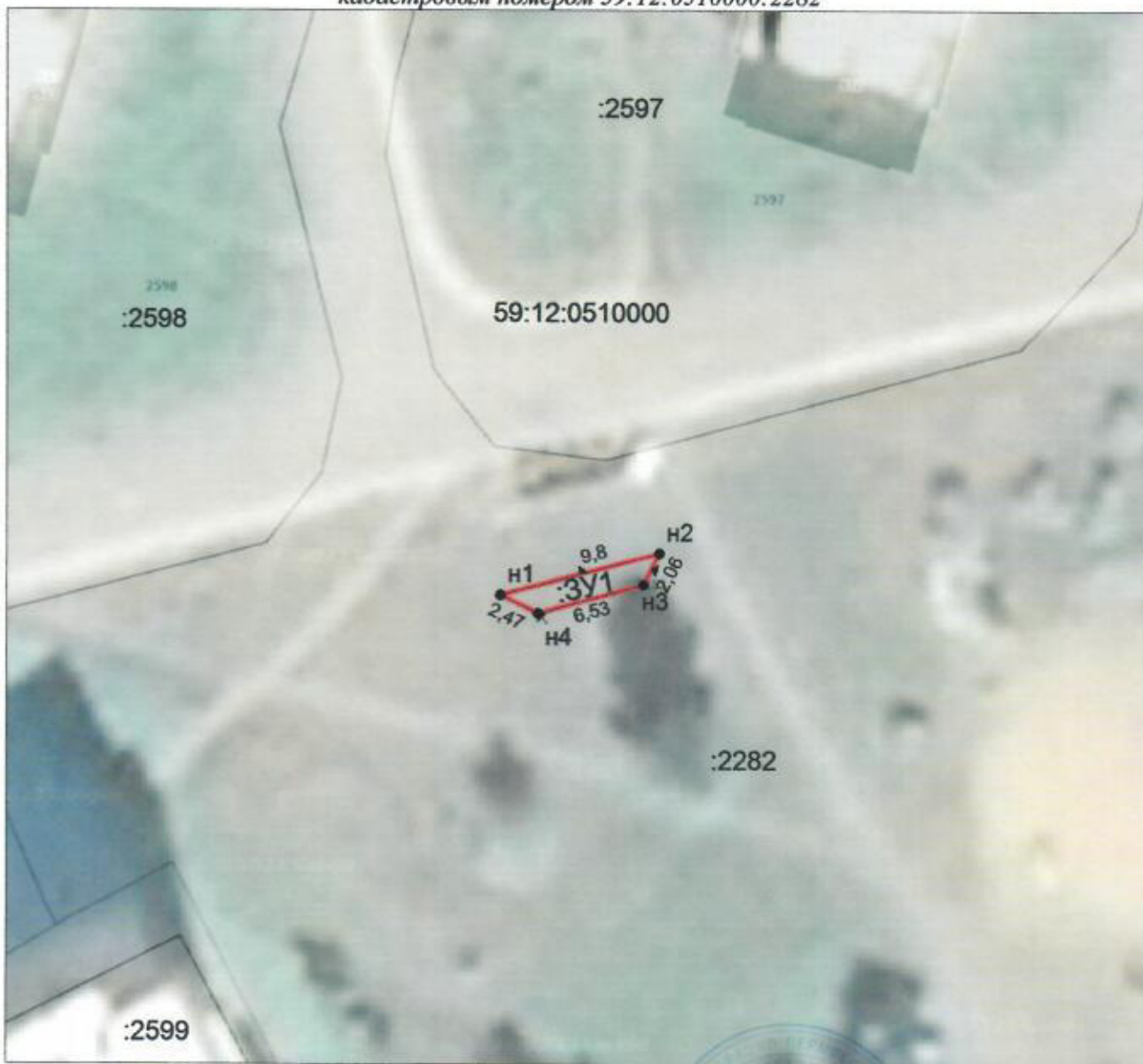
Масштаб 1:400; Система координат МСК-59

Описание границ смежных землепользователей: от точки n1 до точки n1 – земельный участок с кадастровым номером 59:12:0510000:2282