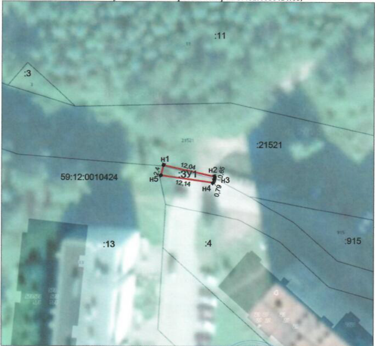
Масштаб 1:500; Система координат МСК-59

От точки n1 до точки n3 – земельный участок с кадастровым номером 59:12:0000000:21521, от точки n3 до точки n5 – земли, находящиеся в государственной собственности; от точки n5 до точки n1 – земельный участок с кадастровым номером 59:12:0010424:13,