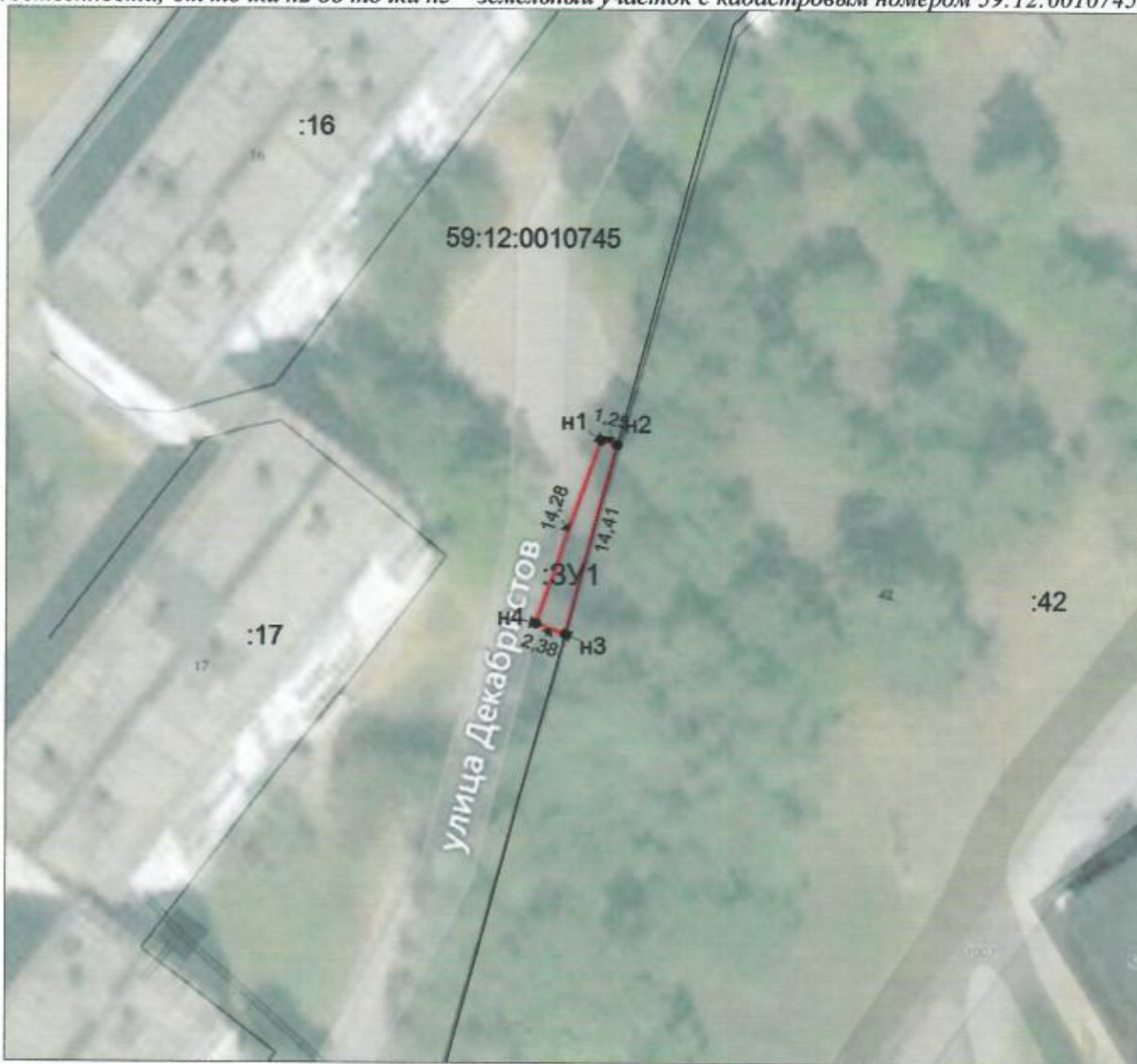
Масштаб 1:500; Система координат МСК-59

От точки n1 до точки n2, от точки n3 до точки n1 – земли, находящиеся в государственной собственности; от точки n2 до точки n3 – земельный участок с кадастровым номером 59:12:0010745:42