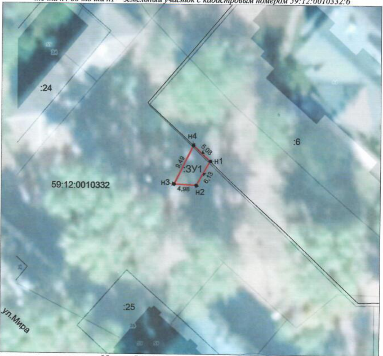
Масштаб 1:500; Система координат МСК-59

От точки н1 до точки н4 – земли, находящиеся в государственной (муниципальной) собственности), от точки н4 до точки н1 – земельный участок с кадастровым номером 59:12:0010332:6