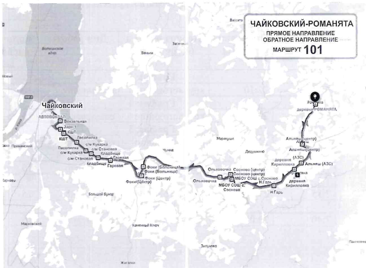
Схема движения транспортных средств по маршруту регулярных перевозок по муниципальному маршруту регулярных перевозок № 101 «г. Чайковский – д. Романята»

Приложение № 3 к Конкурсной документации открытого конкурса на право получения свидетельств об осуществлении перевозок пассажиров и багажа автомобильным транспортом по муниципальному маршруту регулярных перевозок № 15 «стадион «Центральный» - Адонис – стадион «Центральный», по муниципальному маршруту регулярных перевозок № 101 «г. Чайковский – д. Романята», по муниципальному маршруту регулярных перевозок № 103 «г. Чайковский – с. Вассята» по нерегулируемым тарифам в границах Чайковского городского округа