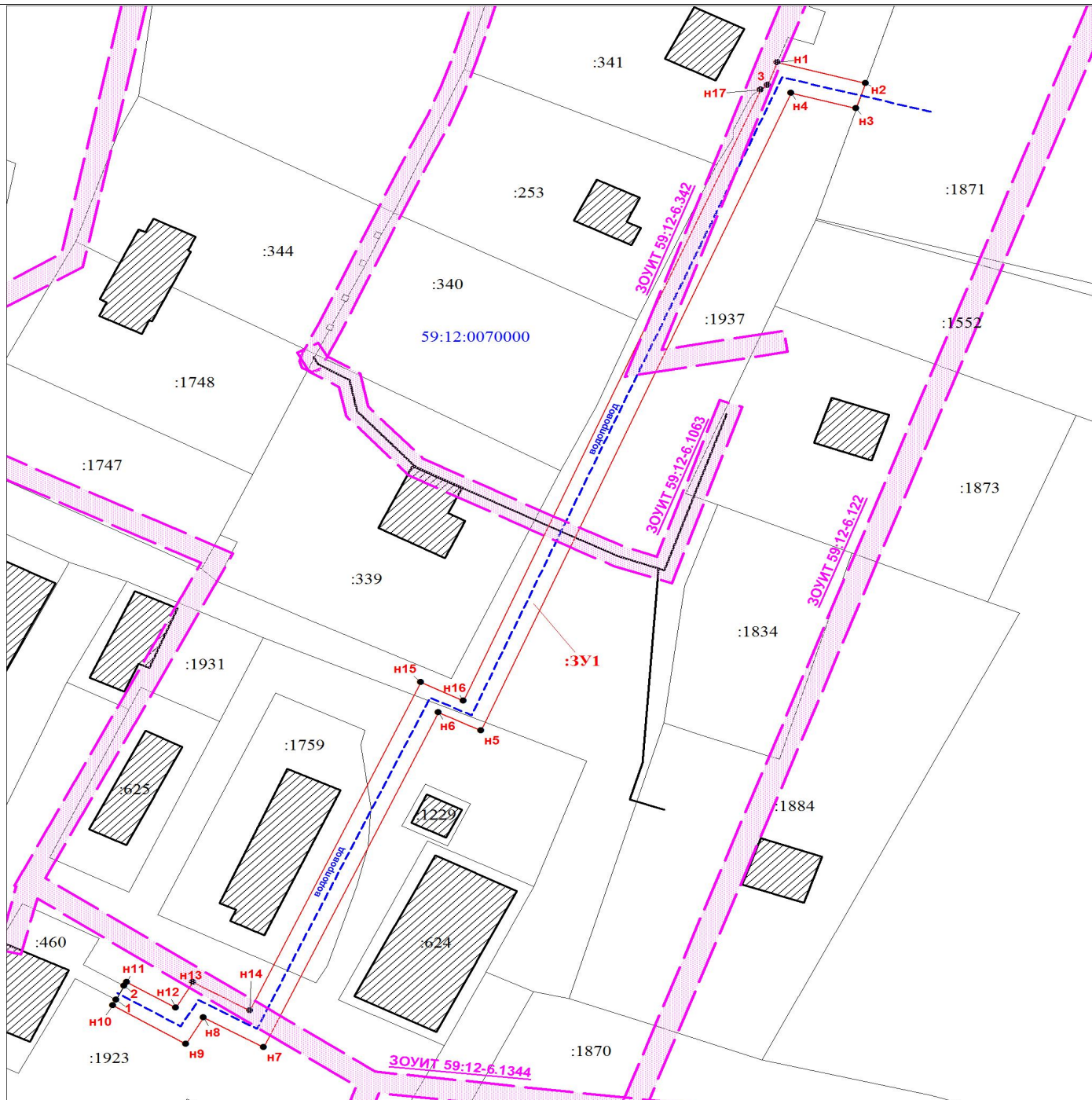
Схема подготовлена на основании КПТ №КУВИ-001/2024-154607584 от 07.06.2024г.