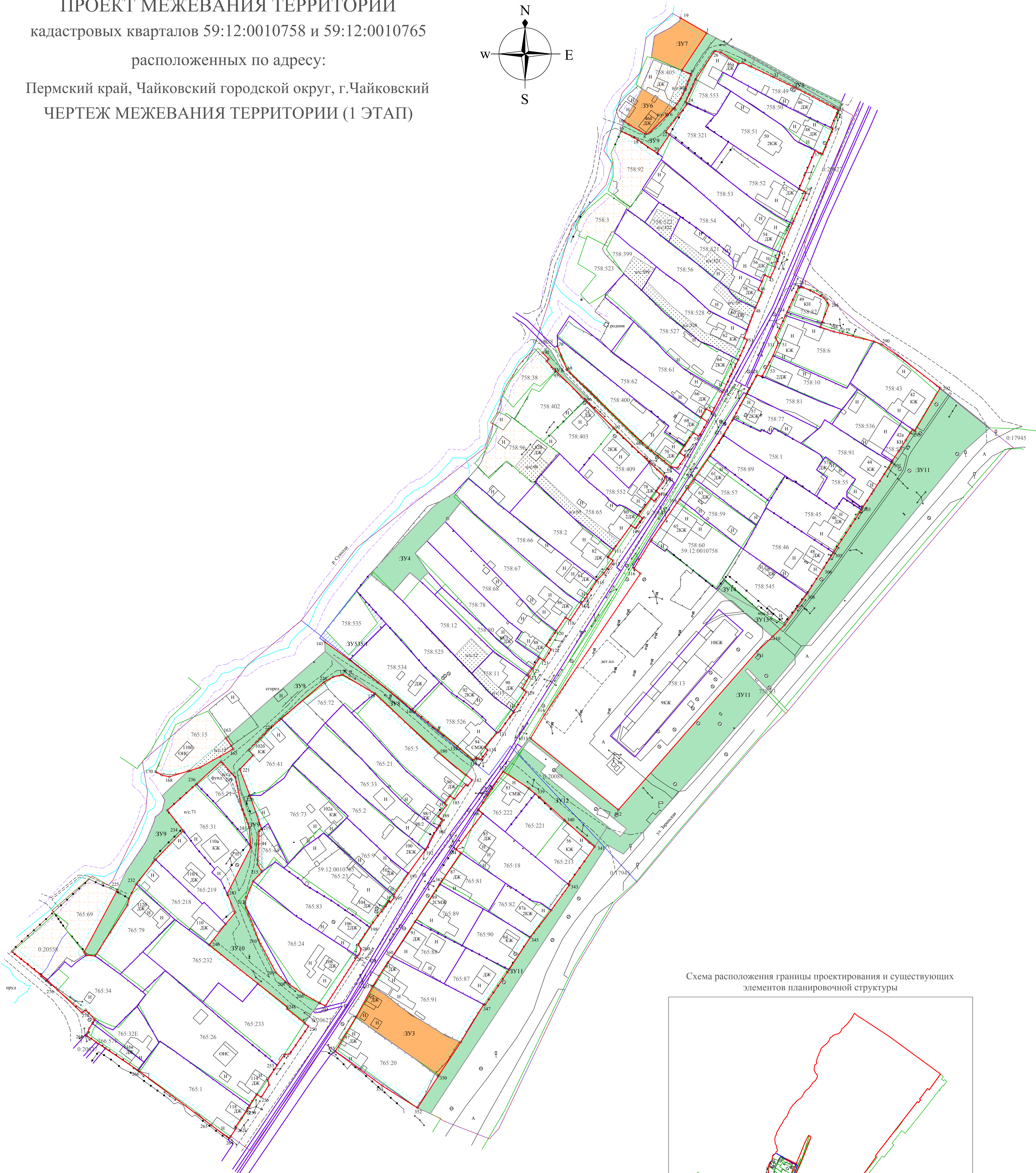
Схема расположения границы проектирования и существующих элементов планировочной структуры