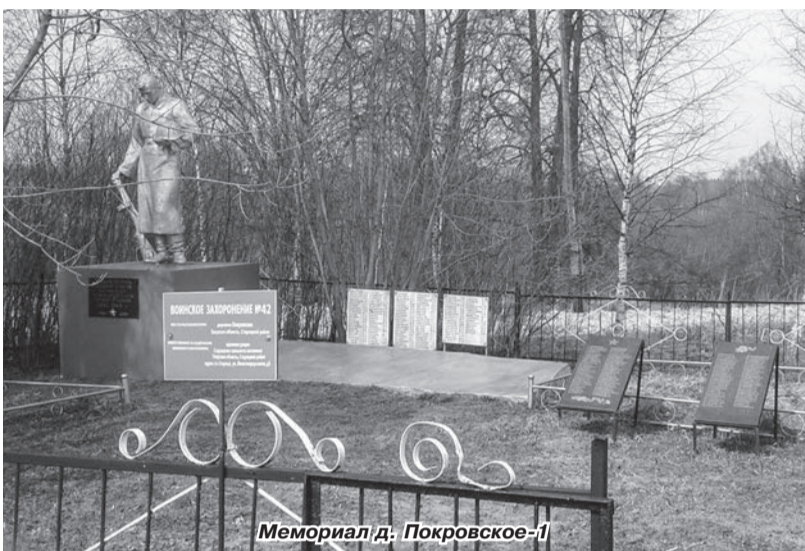
Мемориал д. Покровское-1

В «Огнях Камы» мы уже рассказывали о том, что Советом ветеранов с апреля 2017 г. проводится работа по увековечиванию на местах гибели наших земляков, погибших в Великой Отечественной войне. Мы отправили заявления об увековечивании наших земляков в 103 муниципальных образования России и в 3 области Белоруссии. На сегодняшний день по нашим заявлениям на местах гибели увековечено 148 наших земляков и на 70 человек получены положительные ответы о проводимой работе.