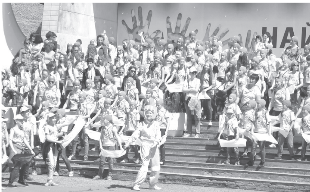
Лариса Сидорова, заместитель министра образования и науки Пермского края:

Подготовка к прошедшему в нашем городе 7 июня первому Празднику детского хорового пения шла долго, а пролетел он в одно мгновение, оставившись в памяти яркой, многоцветной вспышкой, фонтаном позитивных эмоций, хоровым пением и радостным гамом, незабываемыми впечатлениями и сожалением, что всё так быстро закончилось. Да, праздничное действо завершилось, но впечатления, надеемся, будут жить долго.