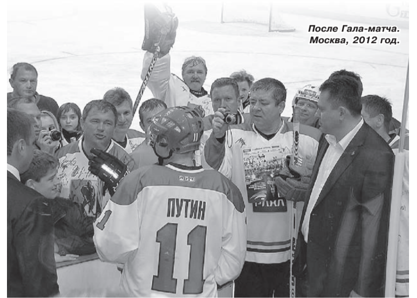
После Гала-матча. Москва, 2012 год.

Проект «Ночная Хоккейная Лига» на федеральном уровне признан самым успешным и массовым спортивным мероприятием, собирающим только на финальную часть более двух тысяч участников и ежегодно привлекающим огромный интерес медиа. Ночная хоккейная лига – тот случай, когда федеральный проект реализован качественно и нареканий почти не вызывает. За три года организаторам удалось вывести дворовый хоккей на тот уровень, когда любители начинают относиться к хоккею, как профессионалы. Уровень команд-финалистов составленных из хоккеистов-любите-