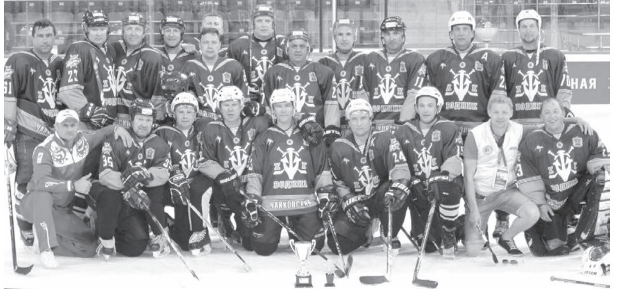
ХК «ВОДНИК» в Сочи, 2013 год.

Можно не сомневаться, что пятый, юбилейный Фестиваль по хоккею среди любительских команд «Ночная Хоккейная Лига» удивит как организацией, так и результатами выступлений. Остаётся надеяться, что Чайковский хоккей на этот раз не останется в стороне от такого масштабного спортивного мероприятия.