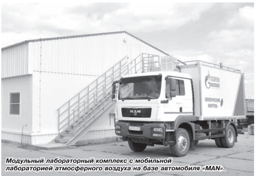
Модульный лабораторный комплекс с мобильной лабораторией атмосферного воздуха на базе автомобиля «MAN».

Особая гордость участка подготовки крановых узлов и гнутых отводов – сварочные работы. Без них невозможно провести ни один ремонт. Всё, что касается любых видов и технологий сварки, любых нововведений в этой области, сначала испытывается в ЦПП, здесь же настраиваются все режимы работы и оборудование, проводятся необходимые процедуры по диагностике и обследованию сварных соединений. И только после этого