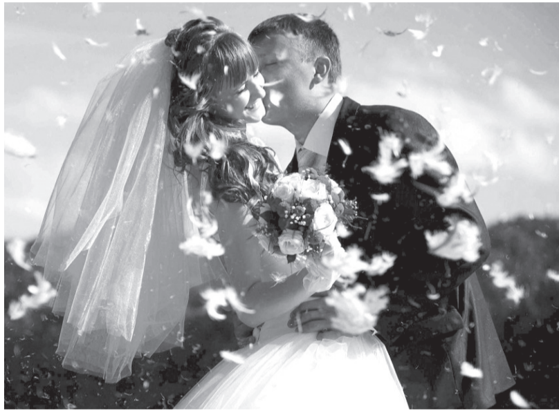
Браки заключаются на небесах gosuslugi.ru

Администрация Чайковского муниципального района сообщает о возможности оплаты государственной пошлины для подачи заявления на регистрацию брака через Единый портал государственных и муниципальных услуг.