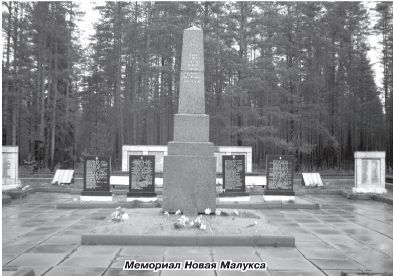
Мемориал Новая Малукса

Мы продолжаем вспоминать тех, кто не вернулся с фронтов Великой Отечественной войны, о наших земляках из Фокинского района, погибших в Кировском (в годы войны Мгинском) районе Ленинградской области в начале 1943 года и позже.