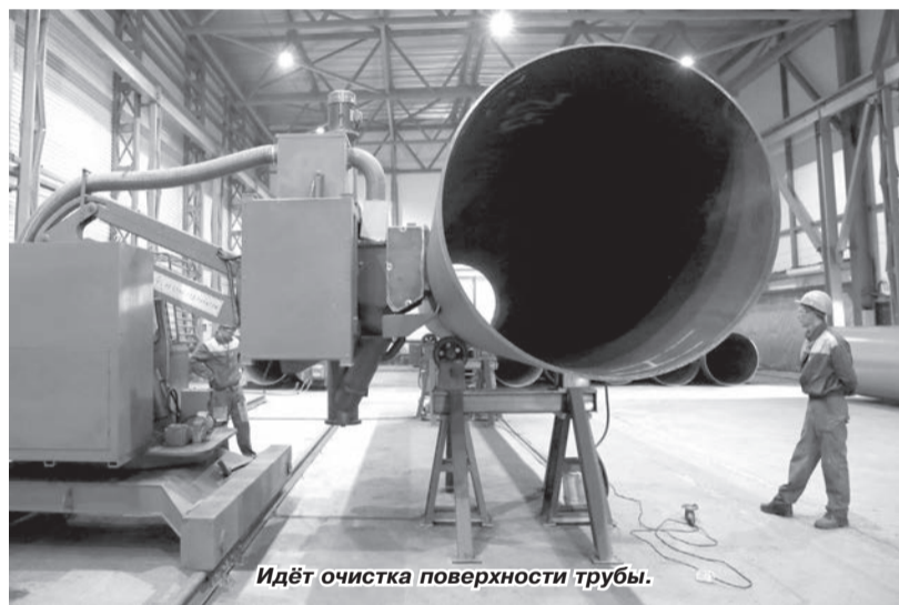
Идёт очистка поверхности трубы.

Интерес ООО «Газпром трансгаз Чайковский» к заводу неслучаен. Демонтированные при проведении капитальных ремонтов магистраль-