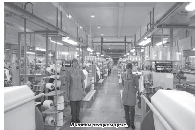
В новом ткацком цехе.