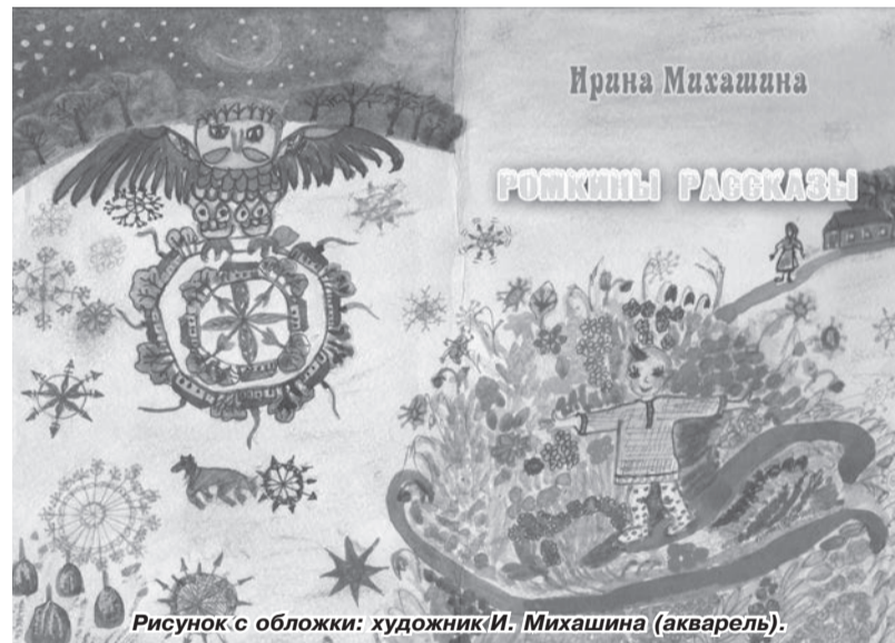
Рисунок с обложки: художник И. Михашина (акварель).