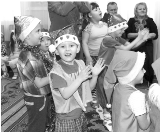
Воспитанники центра на новогоднем празднике.