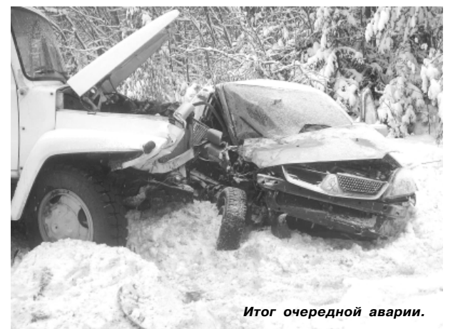
Итог очередной аварии.

Если у вас есть сведения о каких-либо дорожно-транспортных происшествиях, вы можете сообщить об этом по телефонам: 02, т. 4-21-90 (группа розыска ГИБДД), т. 4-21-42 (группа дознания ГИБДД).