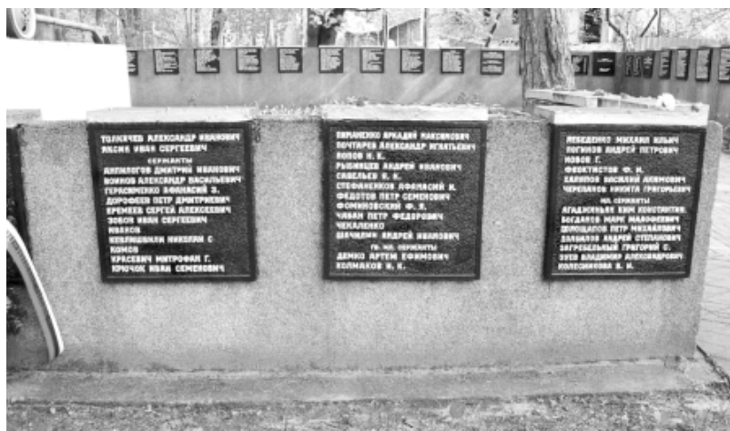
Мемориал под Калининградом. Место захоронения Н.Г. Черепанова.

Удмуртской АССР. Посмертно награжден орденом Отечественной войны 2-й степени.