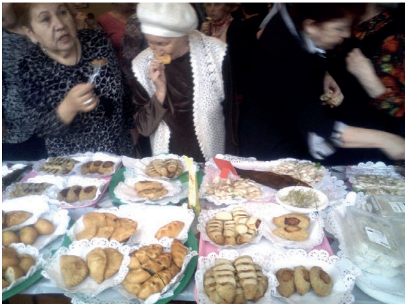
Широкий ассортимент изделий представило на дегустацию ООО «Рыбхоз».

Следом наступил момент, которого с нетерпением ждали все собравшиеся в зале, – розыгрыш многочисленных и разнообразных призов – от большого телевизора, который представило ООО «Эрис», до всякой полезной бытовой и огородной мелочёвки, подготовленных нами с помощью наших деловых партнёров. Призов, конечно же, было тоже пятьдесят. Их судьба находилась в руках двух юных жителей нашего города – девочки и мальчика, которым было поручено извлекать записки с фамилиями счастли