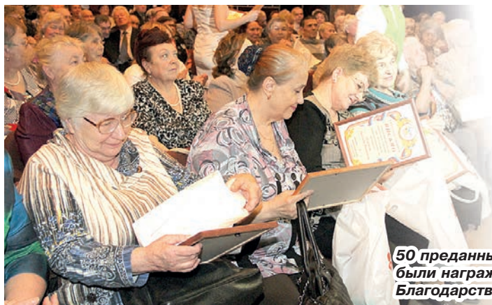
50 преданных подписчиков были награждены Благодарственными письмами.