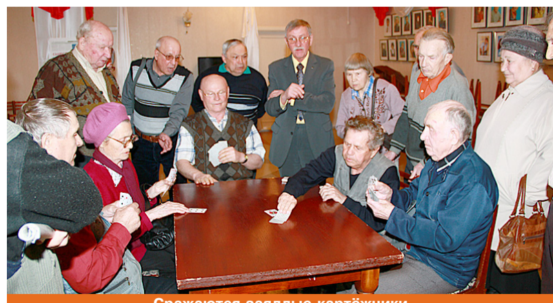
Сражаются заядлые картёжники.

Подробнее об юбилейном празднике "ОК" читайте в пятничном номере.