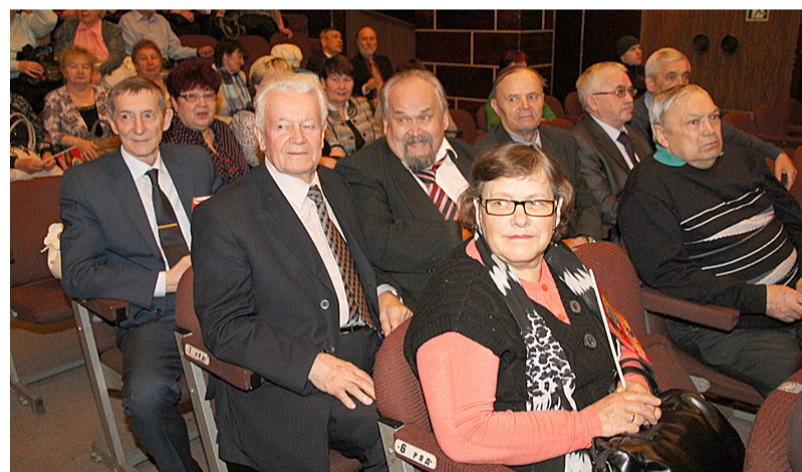
Зал весь внимание.