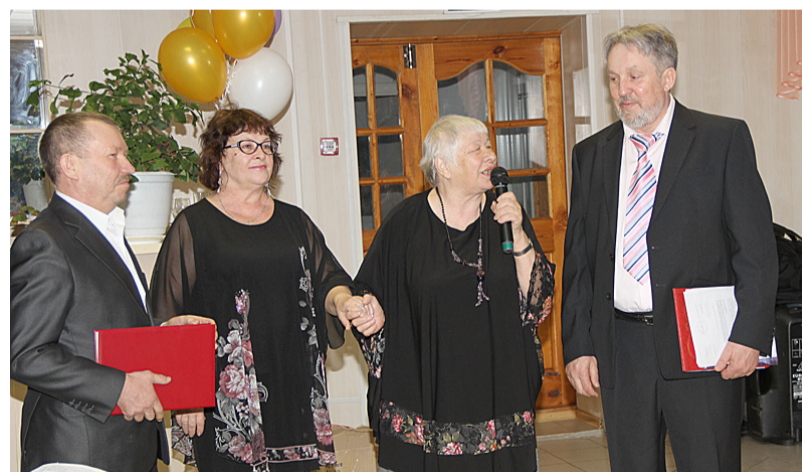
Нас поздравляют наши удмуртские коллеги.