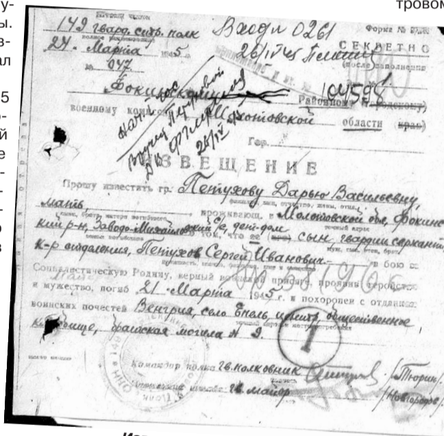
Извещение на С.И. Петухова.

9-я гвардейская армия была перегруппирована из района Кечкемет в период с 8 по 14 марта. К 15 марта она сменила войска 4-й гвардейской армии на участке от Ганта до Дьюлы и заняла исходное положение для наступления. Во второй половине дня 16 марта после мощной артиллерийской подготовки 9-я гвардейская армия В. В. Глаголева и 4-я гвардейская армия Н. Д. Захватаева , перешли в наступление и вклинились во вражескую оборону на 3-7 километров. Противник предпринял ряд контратак. По мере продвижения войск 9-й и 4-й гвардейских армий в юго-западном