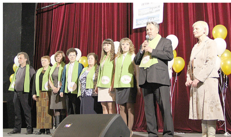
Редакция "ОК" на сцене театра.