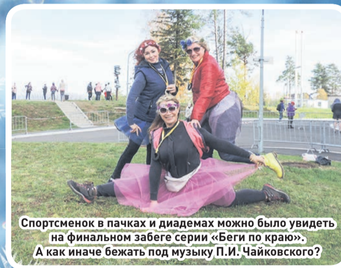
Спортсменок в пачках и диадемах можно было увидеть на финальном забеге серии «Беги по краю». А как иначе бежать под музыку П.И. Чайковского?