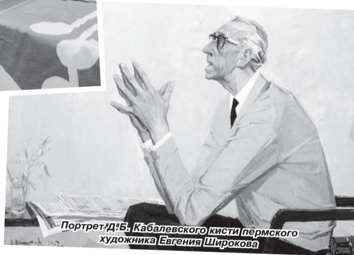
Портрет Д.Б. Кабалевского кисти пермского художника Евгения Широкова

смерти композитора 14 февраля 1987 года Порттовую переименовали в улицу Кабалевского.