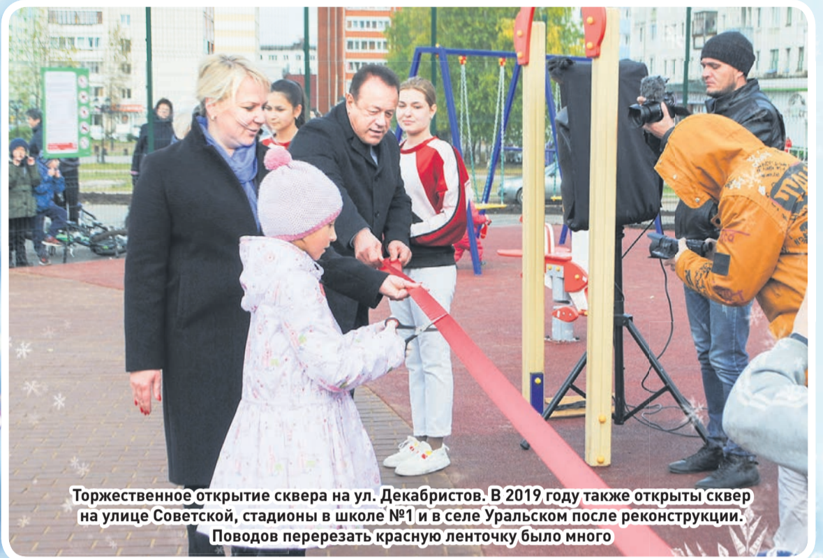
Торжественное открытие сквера на ул. Декабристов. В 2019 году также открыты сквер на улице Советской, стадионы в школе №1 и в селе Уральском после реконструкции. Поводов перерезать красную ленточку было много