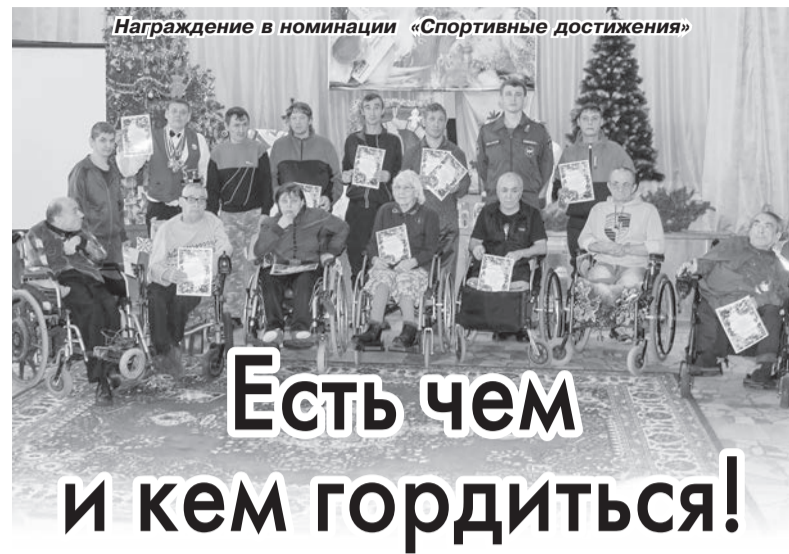
Награждение в номинации «Спортивные достижения»