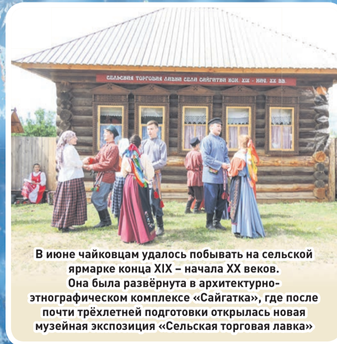
В июне чайковцам удалось побывать на сельской ярмарке конца XIX – начала XX веков. Она была развёрнута в архитектурно-этнографическом комплексе «Сайгатка», где после почти трёхлетней подготовки открылась новая музейная экспозиция «Сельская торговая лавка»

СЛЕДУЮЩИЙ НОМЕР ГАЗЕТЫ ВЫЙДЕТ 3 ЯНВАРЯ 2020 ГОДА