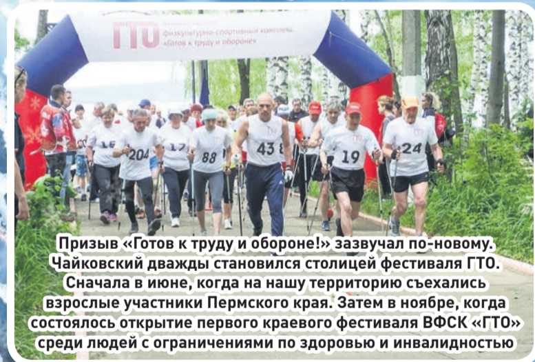
Призыв «Готов к труду и обороне!» зазвучал по-новому. Чайковский дважды становился столицей фестиваля ГТО. Сначала в июне, когда на нашу территорию съехались взрослые участники Пермского края. Затем в ноябре, когда состоялась открытие первого краевого фестиваля ВФСК «ГТО» среди людей с ограничениями по здоровью и инвалидностью