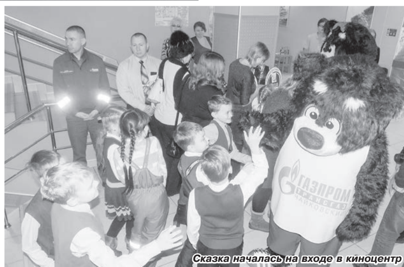
Сказка началась на входе в киноцентр

помощь социозащитным категориям граждан.