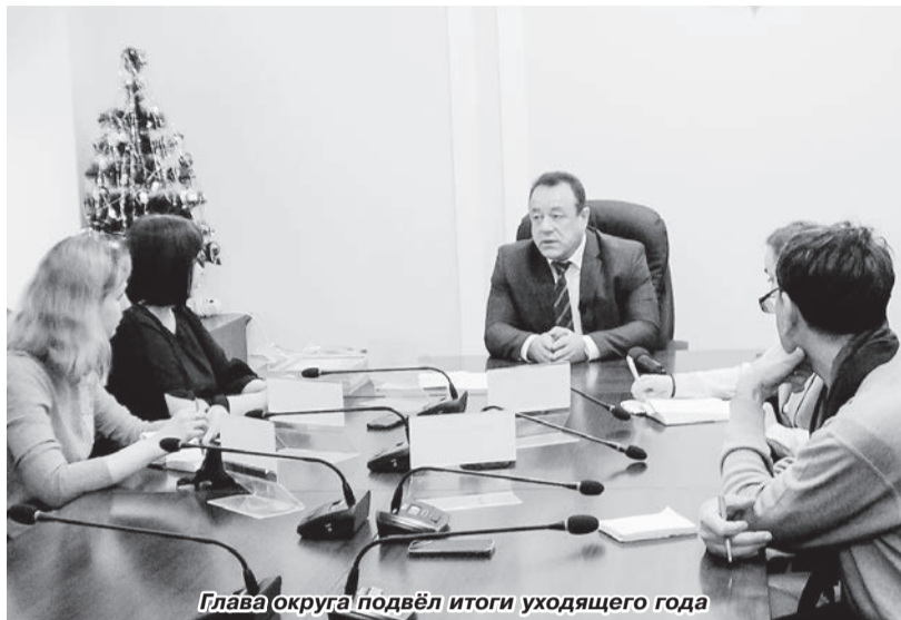
Глава округа подвёл итоги уходящего года