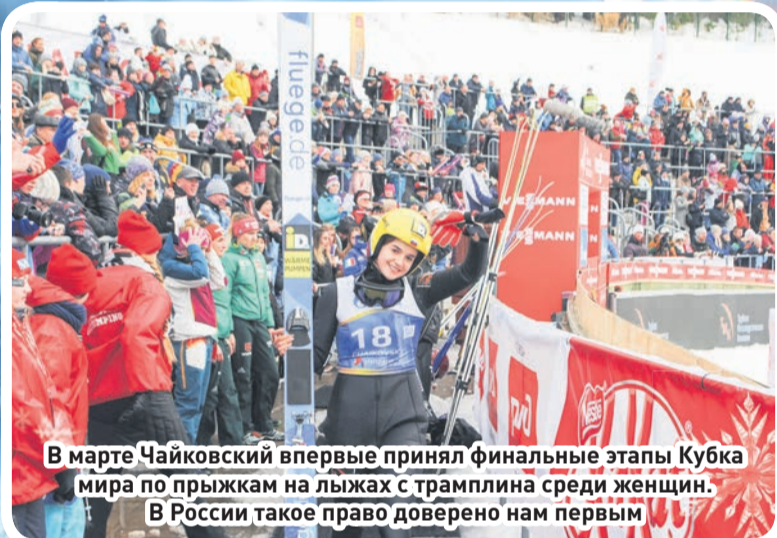
В марте Чайковский впервые принял финальные этапы Кубка мира по прыжкам на лыжах с трамплина среди женщин. В России такое право доверено нам первым