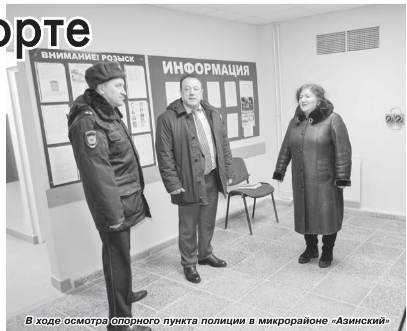
В ходе осмотра опорного пункта полиции в микрорайоне «Азинский»