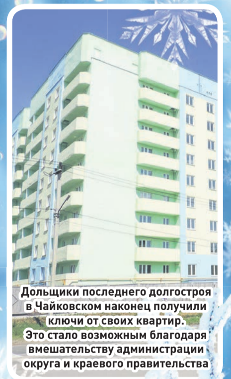
Дольщики последнего долгостроя в Чайковском наконец получили ключи от своих квартир. Это стало возможным благодаря вмешательству администрации округа и краевого правительства