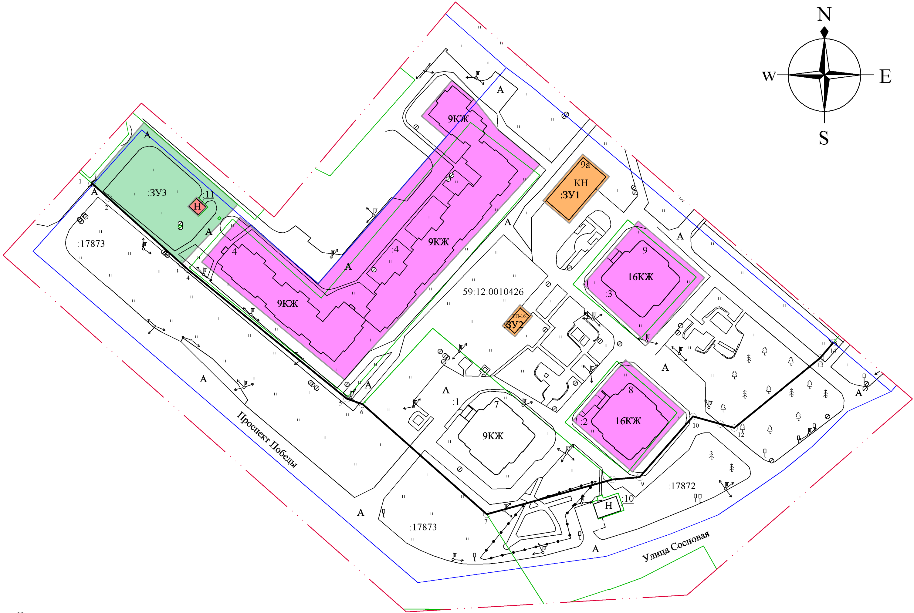
Схема расположения границы проектирования и существующих элементов планировочной структуры

Пермский край, Чайковский городской округ, г.Чайковский