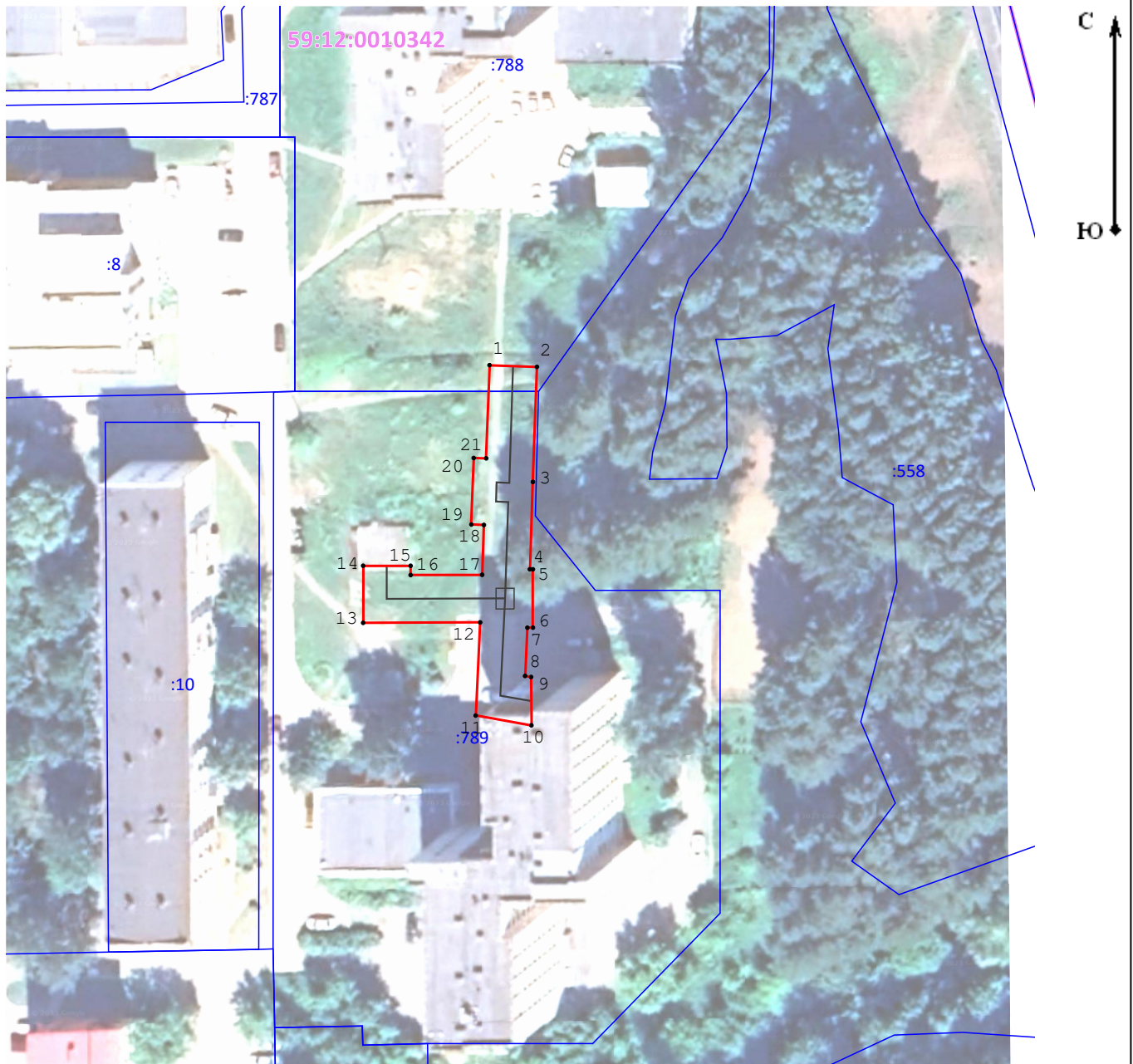
Схема установления границ публичного сервитута