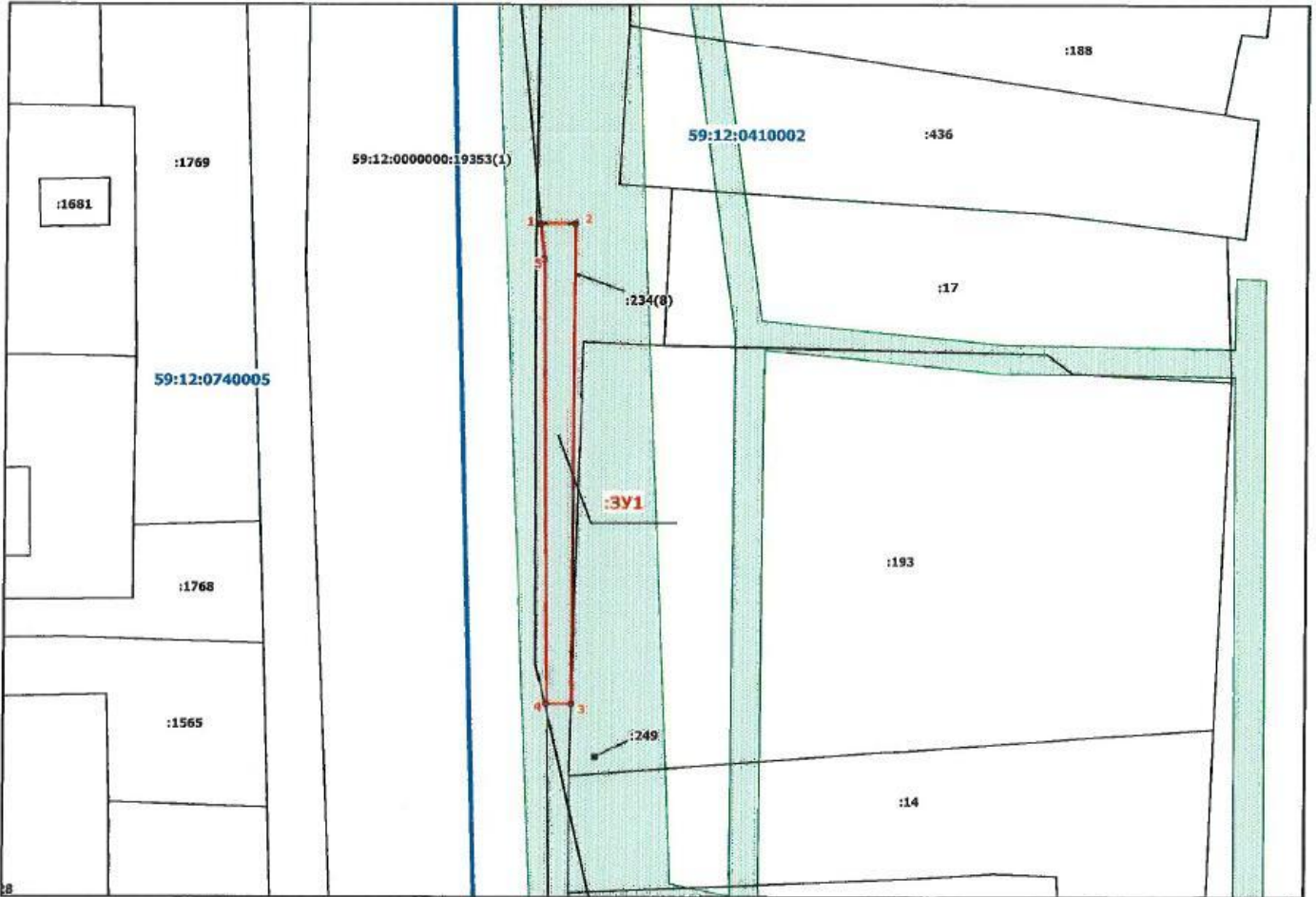
Схема границ земельного участка

Вид разрешенного использования: 3.1. Коммунальное обслуживание